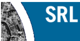
Johannes Dragomir Vereinigung für Stadt-, Regional- und Landesplanung e.V. Regionalgruppe Bayern

Die SRL erwartet sich vom "Bündnis zum Flächensparen" Vorschläge und Ergebnisse, die durch einen verantwortungsvollen Umgang mit allen Aufgaben der Planung und ihrer Umsetzung zumindest mittel- bis langfristig zu einer erheblichen Reduzierung des Flächenverbrauchs in Bayern führen werden.