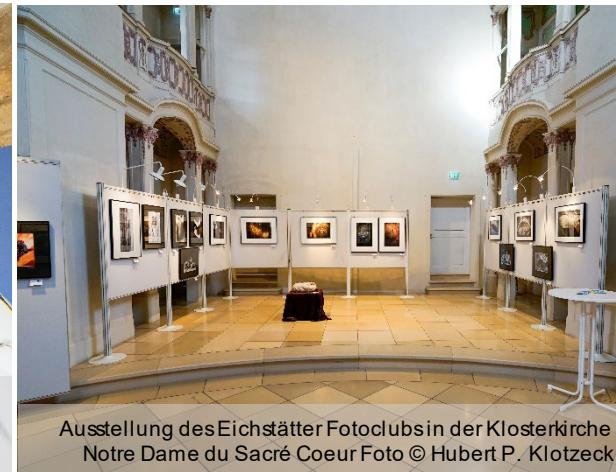
Ausstellung des Eichstätter Fotoclubs in der Klosterkirche Notre Dame du Sacré Coeur