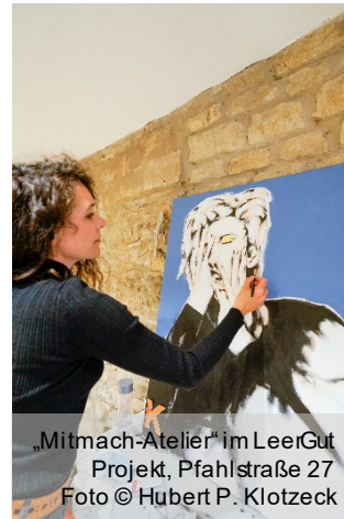
„Mitmach-Atelier“ im LeerGut Projekt, Pfahlstraße 27

Die interdisziplinäre Aktion Eichstätter Galerien, Museen und Kunstschaffenden hat vom 1. bis 3. Oktober 2021 die Innenstadt nach Corona erfolgreich wiederbelebt. Mit Kunst- und Kulturaktionen galt es, Menschen wieder in die Innenstadt zu locken. Es sollte wieder kommuniziert, konsumiert und nicht zuletzt die Kultur der Stadt wahrgenommen werden. Es waren drei Tage Kulturgenuss pur in Eichstätt geboten. Von einem Aktionsort ging es zum anderen, von einer Galerie zum nächsten Museum. Straßen, Plätze und Cafe's waren gefüllt, es herrschte Leben, Freude und Feierlaune. Eichstätter, Gäste, Spontanbesucher und ausgehungerte Kunstgenießer bewegten sich durch die Stadt und brachten pulsierendes Leben. Verteilt auf ca. 30 Aktionsstätten fand in Eichstätt Kultur pur statt – all das, was man seit mehr als einem Jahr vermissen musste. Die Maßnahme konnte innerhalb eines Sonderprojektfonds verwirklicht werden, der mit 38.400 € Städtebaufördermitteln ausgestattet wurde.