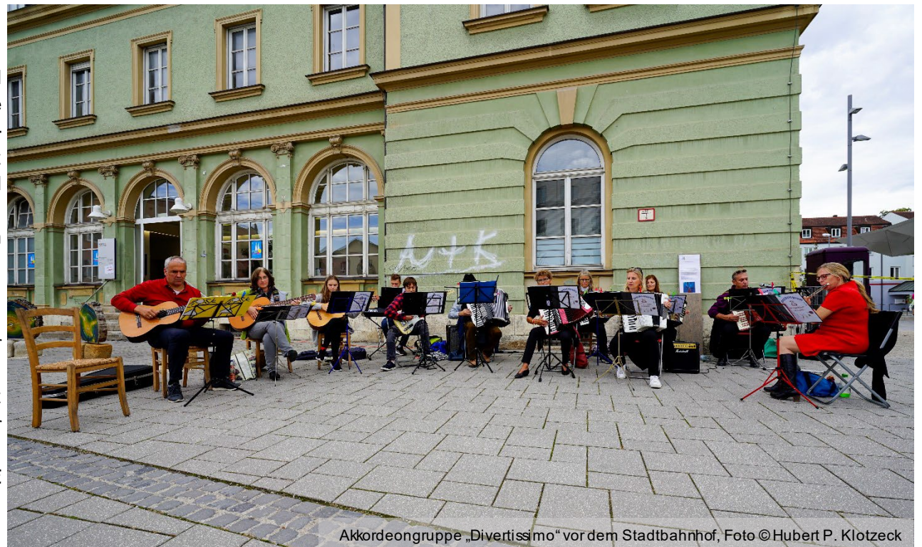
Akkordeongruppe „Divertissimo“ vor dem Stadtbahnhof, Foto © Hubert P. Klotzeck