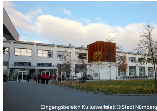
Eingangsbereich Kulturwerkstatt

Nach aufwendiger Sanierung und Umbau der ehemaligen Produktionshallen auf AEG zur Kulturwerkstatt ist eine herausragende Einrichtung der örtlichen Kunst- und Kulturszene entstanden. Das Kulturhaus beherbergt nun das Kulturbüro Muggenhof, den KinderKunstRaum, die Musikschule Nürnberg, das Centro Español sowie die Akademie für Schultheater und Theaterpädagogik. Die multifunktionalen Räume bieten unterschiedliche Raumhöhen bis 12,50 Metern. Das Foyer mit Gastronomie und der große Saal bilden das Zentrum des Ensembles.