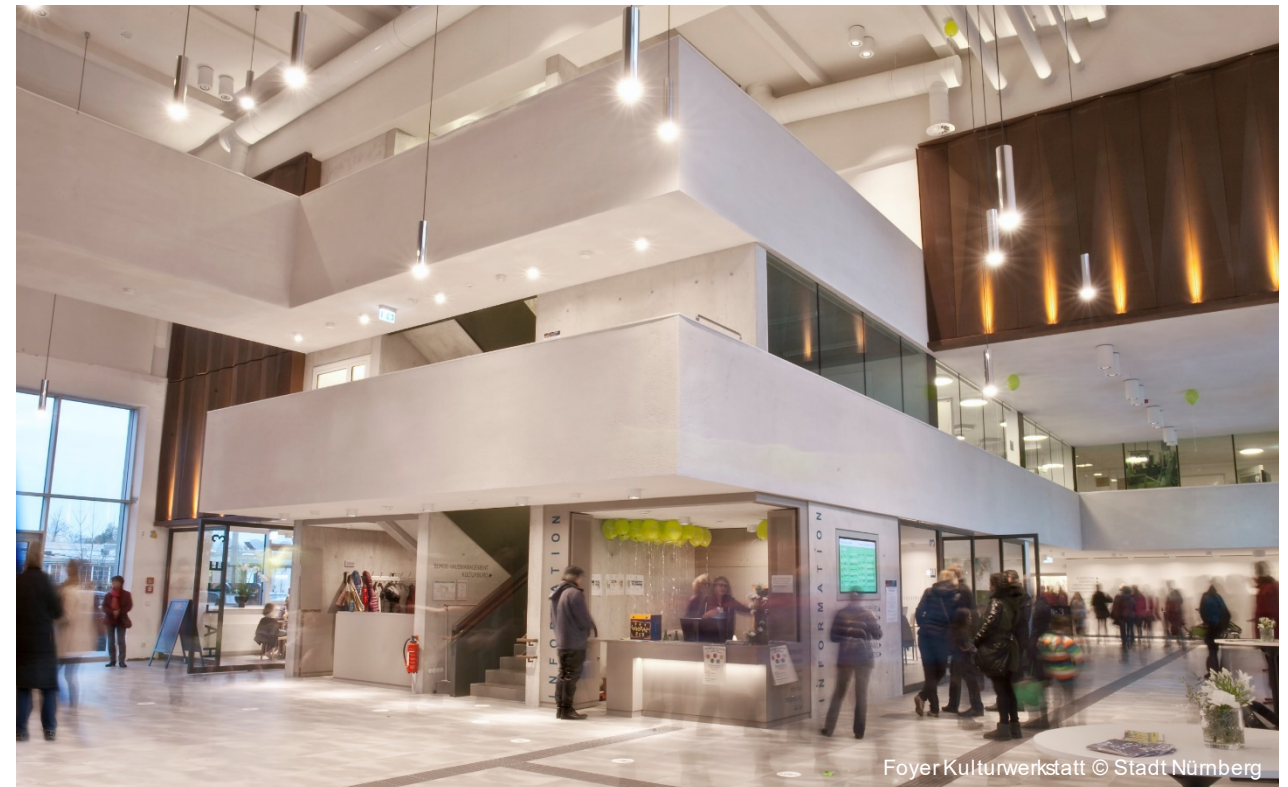
Foyer Kulturwerkstatt